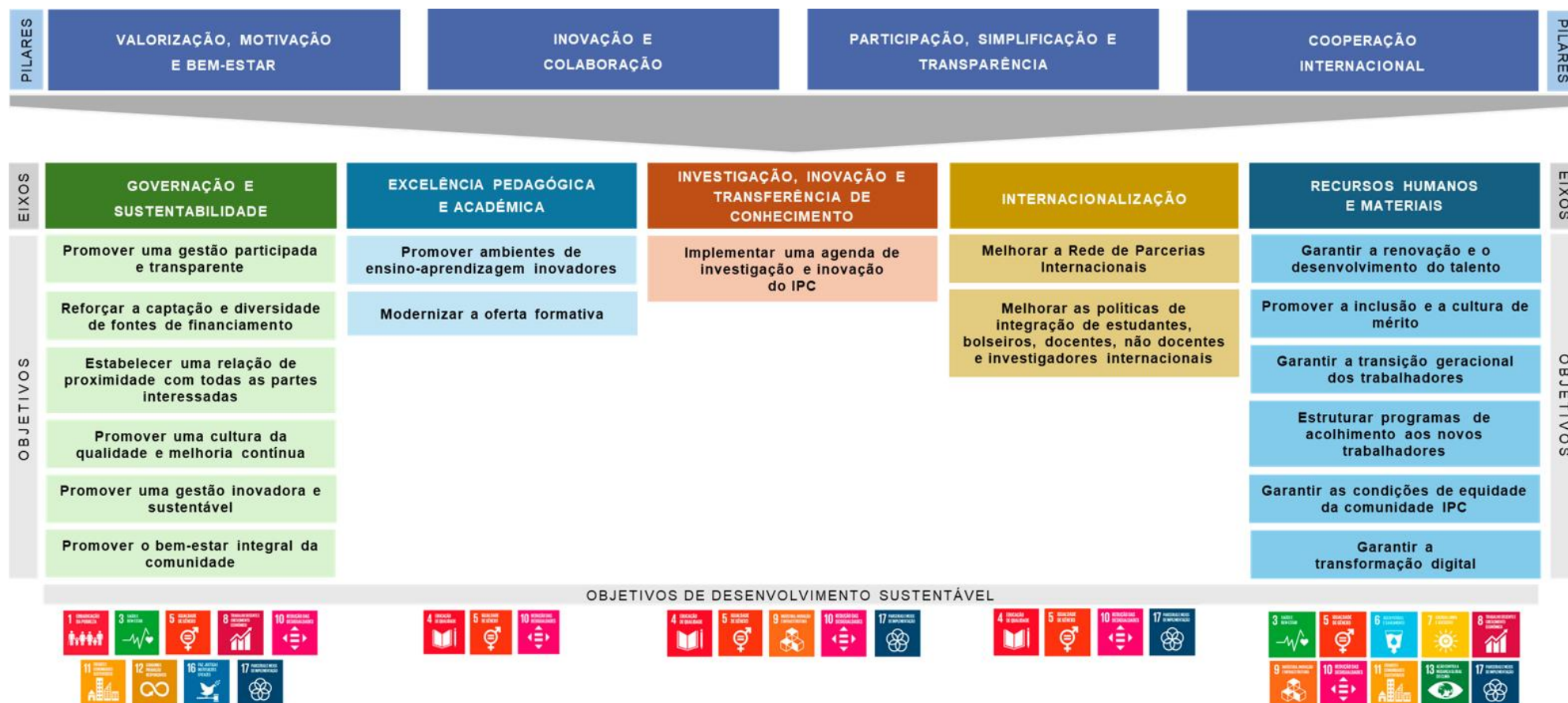
Figura 3 – Mapa Estratégico do IPC 2025-2029