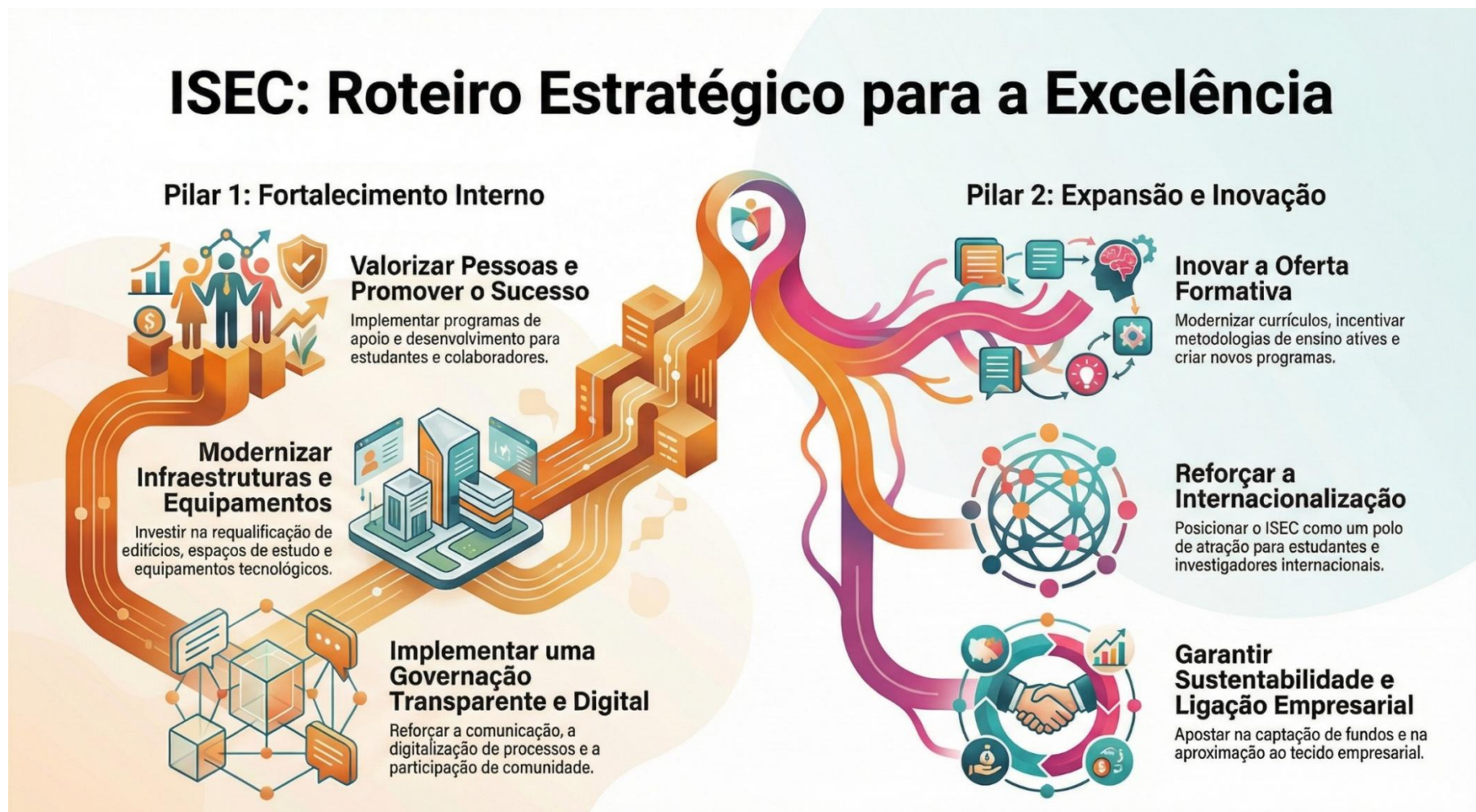
Figura 4 – Infografia Orientações Estratégicas - ISEC

O PAO-ISEC para 2026 alinha-se igualmente com os Eixos Estratégicos previstos para o Plano Estratégico do ISEC, para o quadriénio 2026-2030, estruturado em sete eixos estratégicos (EE):