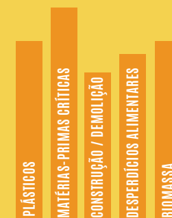
SETORES PRIORITÁRIOS DE INTERVENÇÃO

As ações propostas visam apoiar a economia circular em cada etapa da cadeia de valor : do fabrico ao consumo, à reparação, à gestão de resíduos e à reintrodução de matérias-primas secundárias na economia.